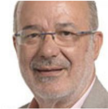
Josep Maria Terricabras

EFA President and first Vice President of the Greens/EFA Group